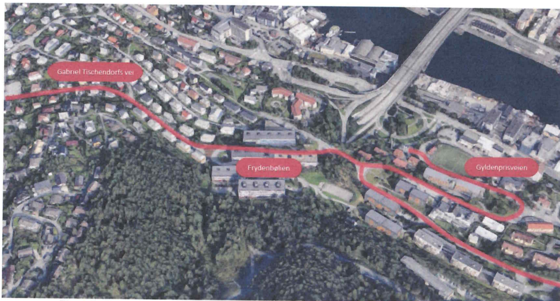
Figur 1: Oversikt over de aktuelle strekningene som inngår i planarbeidet/byggesak

Høsten 2020 ble Sykkelstrategi for Bergen 2020-2030 vedtatt. Formålet med strategien er at flere skal sykle mer og at den totale andelen syklende i Bergen skal øke. Gabriel Tischendorfs vei, Frydenbølien og Gyldenprisveien inngår som prioriterte strekninger i strategien, og skal planlegges for utbygging innen 2030.